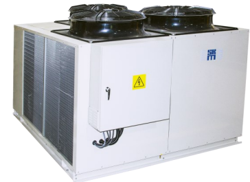
Condensing Units (From 5 TR to 88 TR)