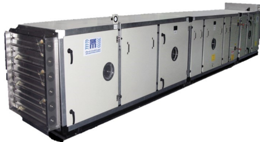
Air Handling Units (From 1000 CFM-60,000 CFM)