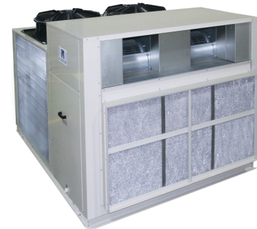
Package Units (From 8 TR to 117 TR)