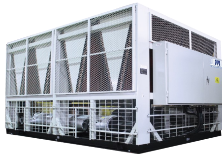
Air Cooled Chillers (From 76 TR to 438 TR)